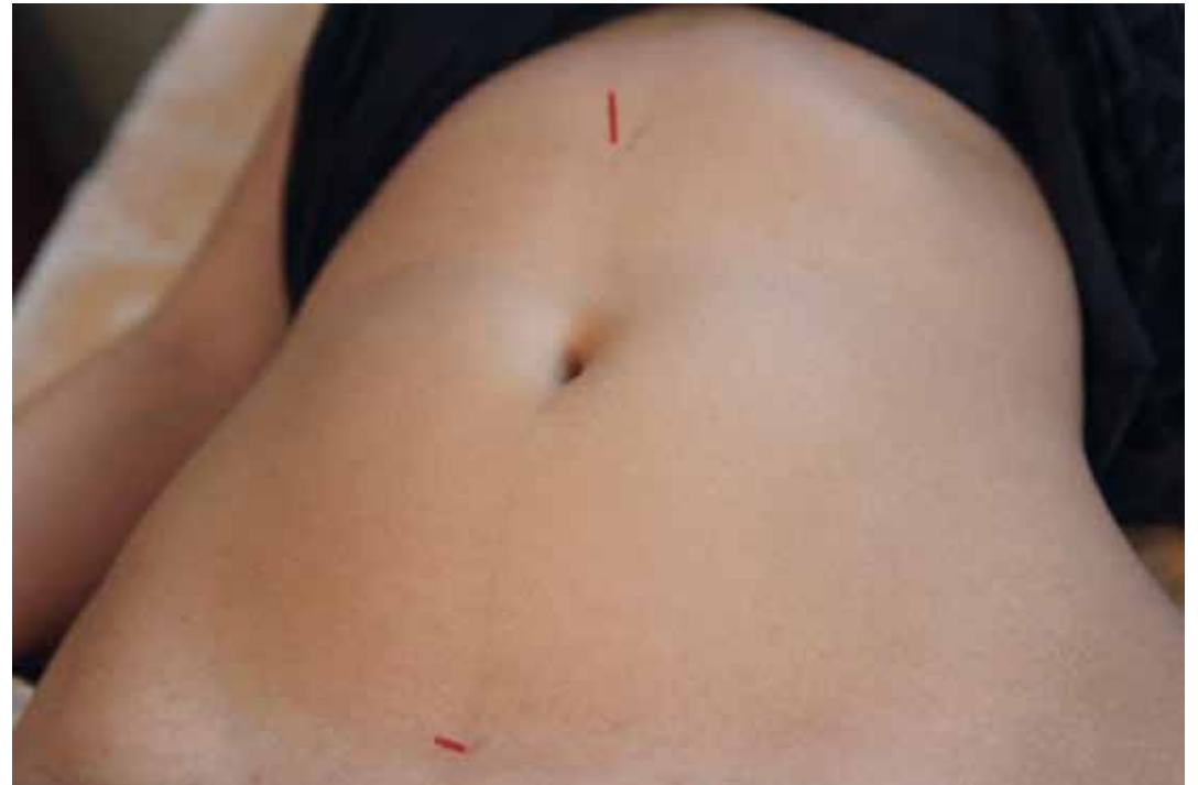
דוגמא לבטן אופיינית עם פתולוגיית chong (הדיקור על ה-CV קשור לטיפול הספציפי ולא מהווה דוגמא לטיפול ב-chong)

הווסת. הן המכיל את הדם, מווסת אותו וקוצב את תנועתו, לתיפקוד נכון של ה-chong השפעה מכרעת על מהלך המחזור והווסת.